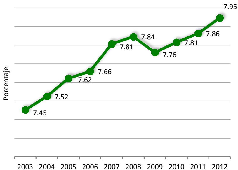
Participación porcentual del PIB del sector terciario de Nuevo León en el nacional