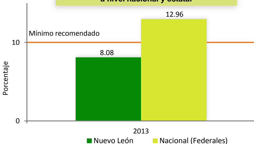
Porcentaje del territorio que ocupan las ANP a nivel nacional y estatal

* En Nuevo León están consideradas 4 ANP federales.